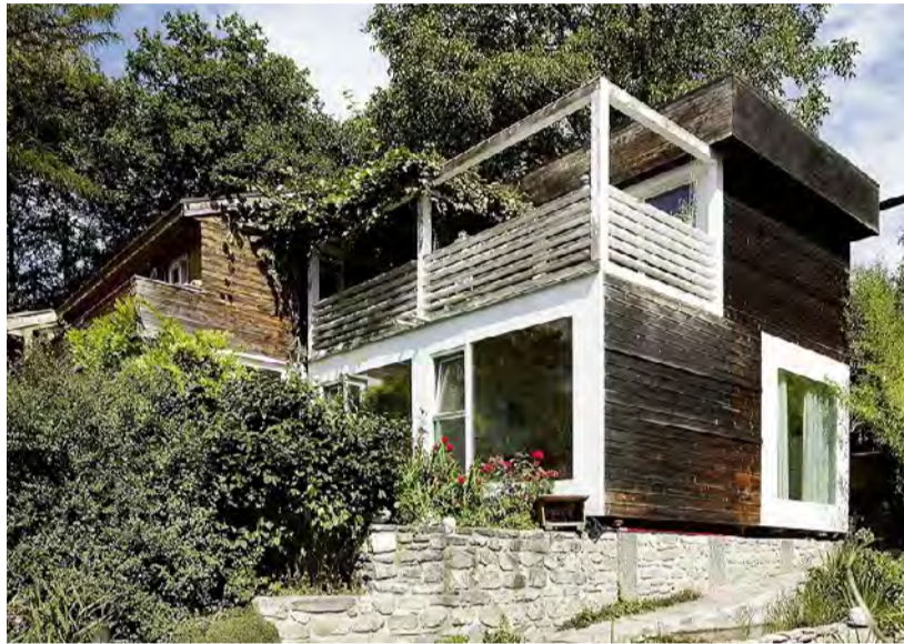
Der Anbau passt zum Bestand, indem er die Oberflächenmaterialien und Farben des Altbaus zwar übernimmt – dunkelbraun gebeizte Holzbretter und weiss gestrichene Holzfenster –, sie aber mit einer eigenen Formensprache neu interpretiert.

Trotzdem haben ältere Hauseigentümer häufig den Wunsch, das vertraute Haus und das angestammte Wohnumfeld zu behalten. Und dafür gibt es gute Gründe: Bei langjährigem