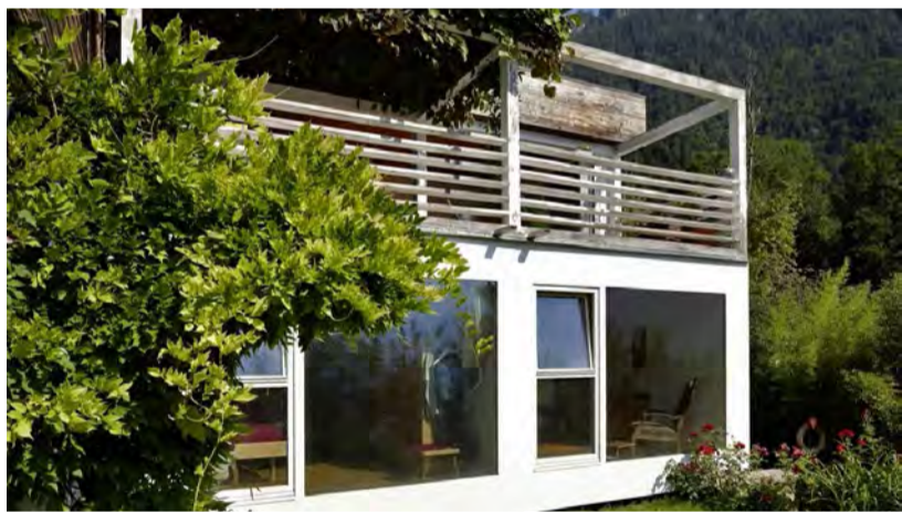
Bei der Hausteilung gingen im Erdgeschoss die Schlafzimmer verloren. Sie wurden durch zwei neue Zimmer im Anbau ersetzt. Darüber liegt die grosszügige Terrasse der neuen Obergeschosswohnung.

Jedes Stückchen Schokolade, das man isst, soll das Leben um 2 Minuten verkürzen. Ich habe das mal ausgerechnet. Ich bin also 1543 gestorben.